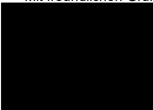
Leiter Schallschutz & Umwelt