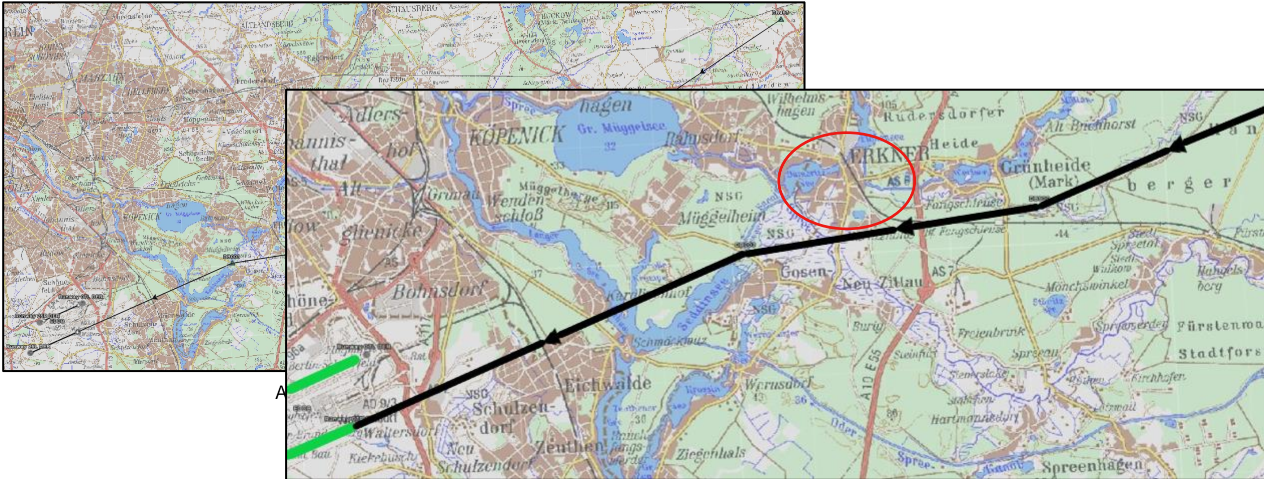
Anflug auf RWY 25L im Nahbereich